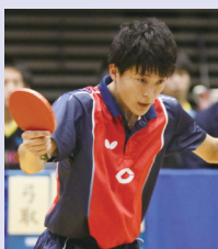
野田学園高校出身

Q 4年間で1番楽しかった事は何？ A 寮生活 Q 4年間で1番つらかった事、苦しかった事は？ A ホームシックになったこと Q 4年前の1年生の自分に一言アドバイスするとしたら？ A 楽しいことしかないから全力で頑張ろう！ Q 心に残っている試合を教えてください A 3年生の全日学ダブルス予選 Q コロナ禍で1番辛かった事は？ A 自由に出かけられないこと Q 4年間の自分、褒めるとしたらどんなところ？ A 諦めず最後までやりきったこと Q 4年間の自分、反省するところは？ A やり残したことに挑戦しておくべきだった Q 卒業にあたって1番感謝を伝えたい人は？ A 両親 Q これからの目標を一言をお願いします A これからも沢山働いて沢山遊びます！ Q 監督に一言 A 感謝しかありません。本当にありがとうございました！