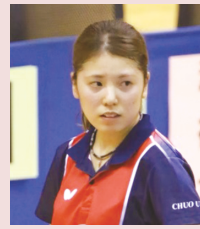
福井商業高校出身

Q 4年間で1番楽しかった事は何？ A 南平での寮生活 Q 4年間で1番つらかった事、苦しかった事は？ A 最後の年にリーグ戦が出来なかった事 Q 4年前の1年生の自分に一言アドバイスするとしたら？ A もっと考えて行動すること Q 心に残っている試合を教えてください。 A 3年生の時にインカレのラストで負けた事 Q コロナ禍で1番辛かった事は？ A モチベーションの維持ができなかった Q 4年間の自分、褒めるとしたらどんなところ？ A 目標をもって日々練習に取り組めたところ Q 卒業にあたって1番感謝を伝えたい人は？ A 両親 Q これからの目標を一言をお願いします A 全日本ランク入り Q 監督に一言 A 期待通りの結果を出せず、勝てないばかりでしたがそれでも団体戦に出させていただき本当に感謝しています。