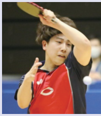
希望が丘高校出身