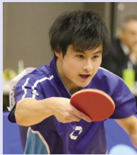
希望が丘高校出身

Q 4年間で1番楽しかった事は何？ A 試合の次の日のオフ Q 4年間で1番つらかった事、苦しかった事は？ A リーグ戦、インカレ自分が負けてチームも負けた時 Q 4年前の1年生の自分に一言アドバイスするとしたら？ A 1年生の時から誰よりも練習しなさい Q 心に残っている試合を教えてください A 負けた試合はだいたいわっています。笑 Q コロナ禍で1番辛かった事は？ A 団体戦ができなかったこと Q 4年間の自分、褒めるとしたらどんなところ？ A 毎日やろうと思った事に妥協しなかったこと Q 4年間の自分、反省するところは？ A 言い訳したとき Q 卒業にあたって1番感謝を伝えたい人は？ A 両親 Q これからの目標を一言をお願いします A まだ全国大会のタイトル取ったことないから社会人で優勝！