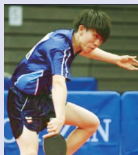
専修大学北上高校出身