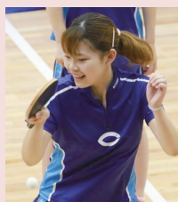
山口県立岩国商業高校出身