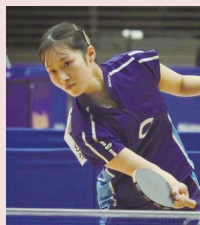
帝京高校 / JOC エリートアカデミー出身