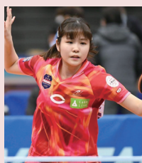
四天王寺高校出身